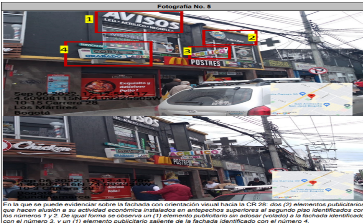
En la que se puede evidenciar sobre la fachada con orientación visual hacia la CR 28: dos (2) elementos publicitarios que hacen alusión a su actividad económica instalados en antepechos superiores al segundo piso identificados con los números 1 y 2. De igual forma se observa un (1) elemento publicitario sin adosar (volado) a la fachada identificado con el número 3, y un (1) elemento publicitario saliente de la fachada identificado con el número 4.