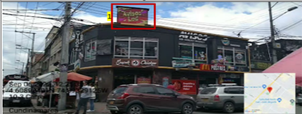
Fotografía No. 3

En la que se puede evidenciar en la fachada con orientación visual hacia la CR 28: un (1) elemento publicitario con publicidad en movimiento que hace alusión a su actividad económica (ver anexo 5, 6 y 7), instalado en antepechos superiores al segundo piso identificado con el número 1.