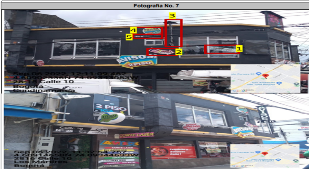
En la que se puede evidenciar con la fachada con orientación hacia la CL 10: un (1) elemento publicitario incorporado en la ventana identificado con el número 1, de igual forma se observa un (1) elemento publicitario sin adosar (volado) a la fachada identificado con el número 3, dos (2) elementos publicitarios instalados en antepechos superiores al segundo piso identificados con los números 4 y 5, y un (1) elemento publicitario adicional con relación al único permitido por fachada de establecimiento identificado con el número 2.