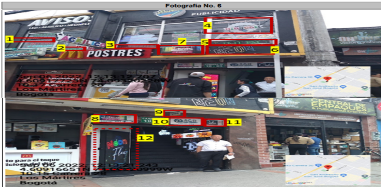
En la que se puede evidenciar sobre la fachada con orientación visual hacia la CR 28: cinco (5) elementos publicitarios incorporados en las ventanas del establecimiento identificados con los números 1, 2, 3, 4, y 5, de igual forma se observa un (1) elemento sin adosar (volado) a la fachada identificado con el número 9, y seis (6) elementos publicitarios adicionales con relación al único permitido por fachada de establecimiento identificados con los números 6, 7, 8, 10, 11 y 12.