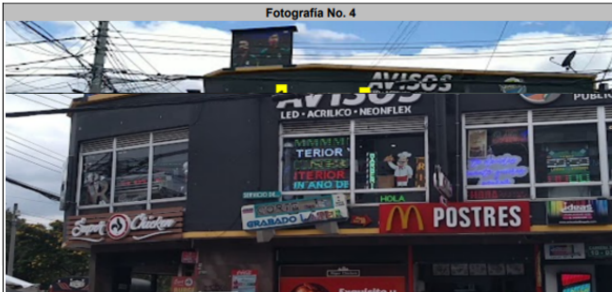
En la que se puede evidenciar en la fachada con orientación visual hacia la CR 28: seis (6) elementos publicitarios con publicidad en movimiento identificados con los números 1, 2, 3, 4, 5, y 6 (ver anexos 5, 6 y 7), los cuales se encuentran incorporados en las ventanas.